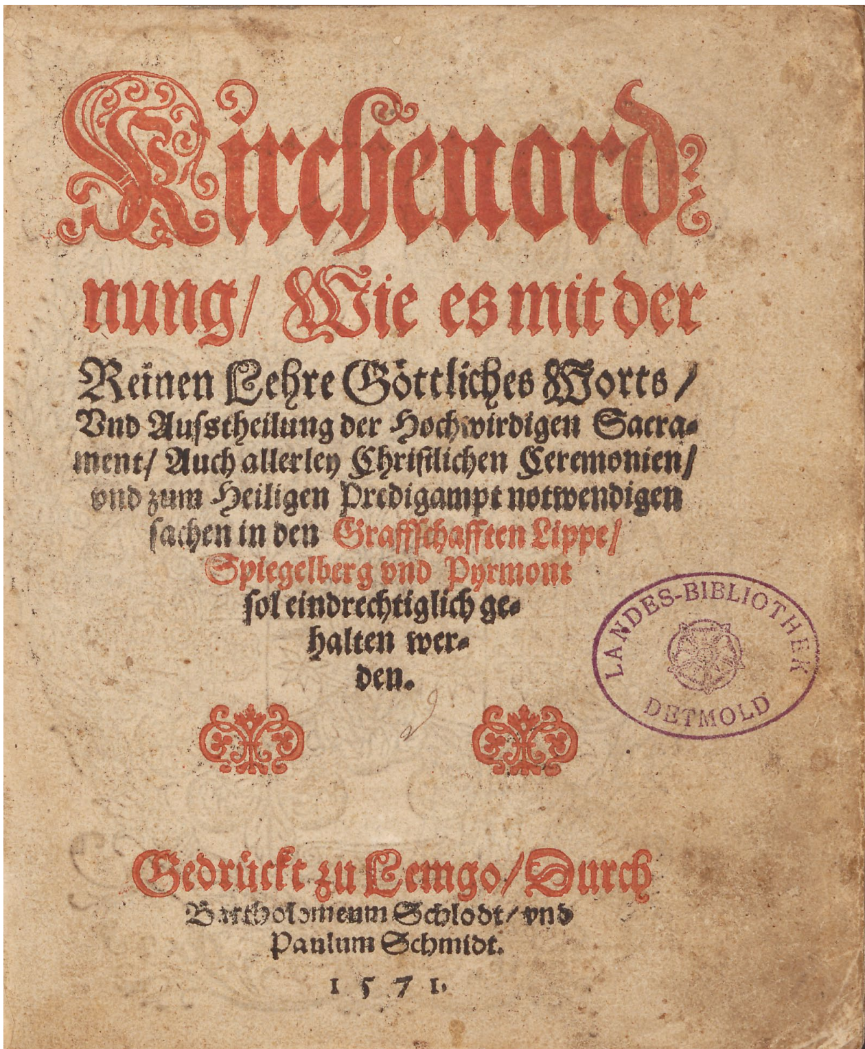
Titelblatt und S. 36 der Lippischen Kirchenordnung von 1571.