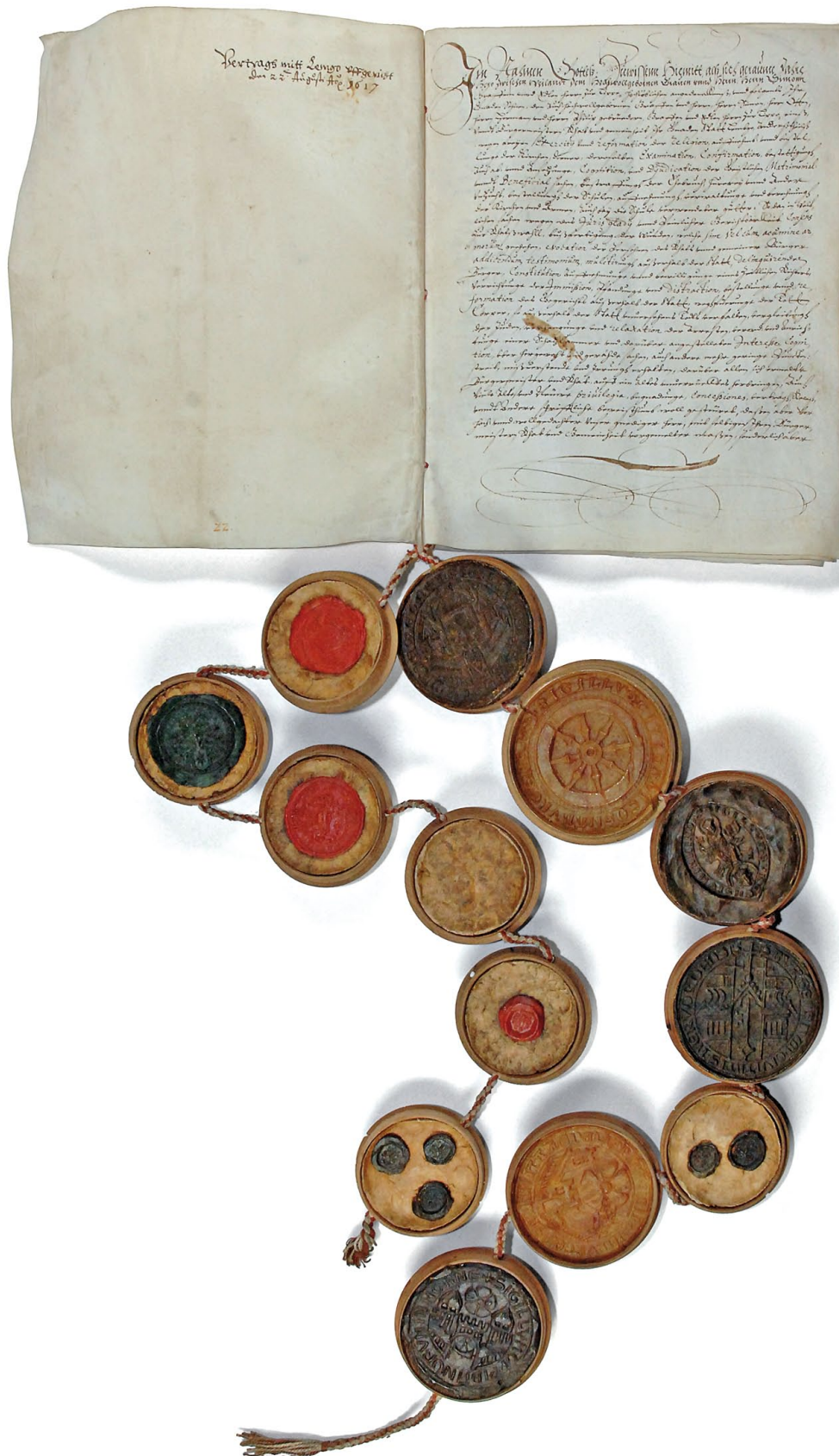
Urkunde des Röhrentruper Rezesses vom 22. August 1617. LAV NRW OWL L 1 1617 Aug. 22